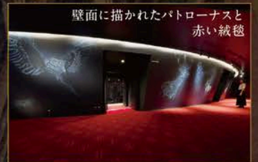
壁面に描かれたパトローナスと赤い絨毯

国の劇場と比べ、日本の天井の空が一番上手く描けているとコメント！キャストボードやカフェのカウンターなどは、木材の色味や素材感にも本国デザイナーがこだわり、実現したものです。